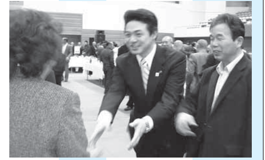
ご支援ありがとうございます