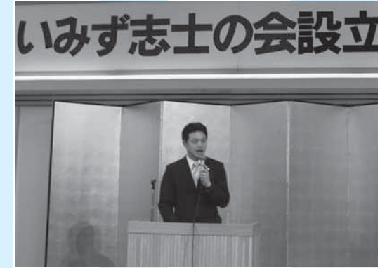
いみず志士の会 設立総会