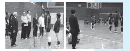
第4回 なつの元志杯 ビーチボール大会