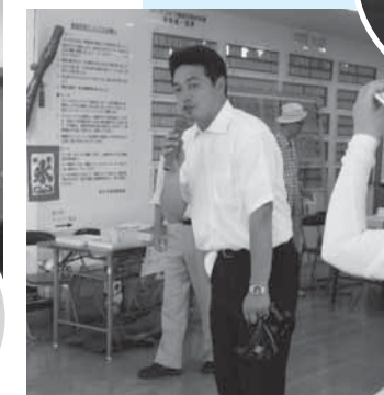
第8回 下支部パークゴルフ大会