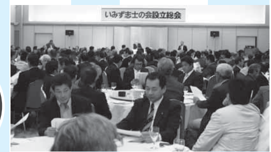
たくさんの方々にお集まりいただきました