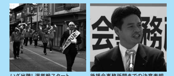
いざ出陣! 選挙戦スタート