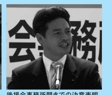
後援会事務所開きでの決意表明