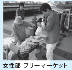
女性部 フリーマーケット