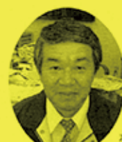
なつの元志後援会 金山支部長

りません。そうすれば、昨今の市町村合併を経て、将来導入されるといわれている道州制といった、さらなる激動の時代の中でも、この地域は、老若男女すべての人の笑顔の絶えない地域として生き残っていくことができるでしょう。