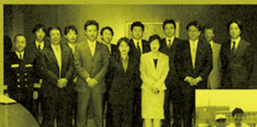
H17.11.1~2 自民党青年部 北海道視察