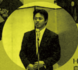
H17.11.13 自民党三部局合同研修会