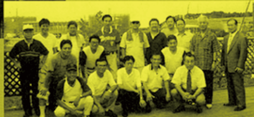
H16.8 全国県議会野球大会